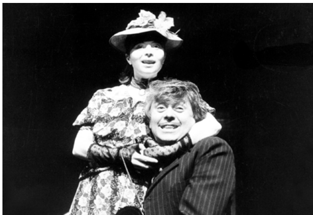
V. Havel: Žebrácká opera (režie J. Menzel, 1990)