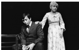
E. O'Neill: Cesta dlouhého dne do noci (režie L. Smoček, 1978)

jako na jevišti – jeden druhému neotevřeli. Ale nebylo to nic soukromého: učinili své soukromé city a pocity materiálem jednání svých postav, protože na jevišti nikdy neexistovali