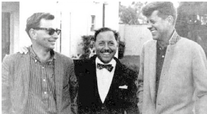
Gore Vidal, Tennessee Williams a J. F. Kennedy