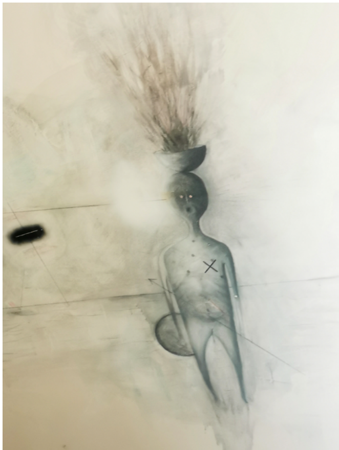
Tom Ciller 24/2/2022