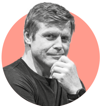
Zbyněk Fric DUNCAN, skotský král