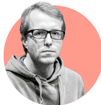
Viktor Zavadil PRVNÍ VRAH, dříve setník skotského vojska