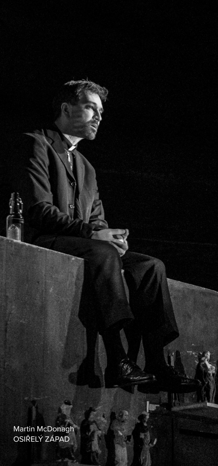
Martin McDonagh OSIŘELÝ ZÁPAD