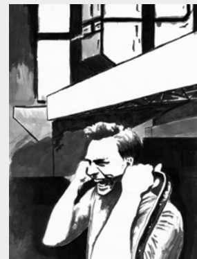
Ilustrace k inscenaci EQUUS

něžné označení pro štých (bodový reflektor, který sleduje pohyb herce po scéně); poprvé zaznamenáno na svícené zkoušce OŠKLIVCE; výraz užívá režisér Braňo Holíček