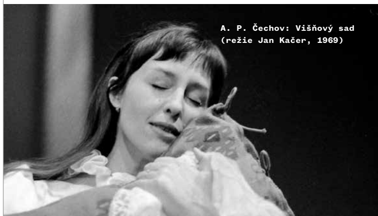
A. P. Čechov: Višňový sad (režie Jan Kačer, 1969)